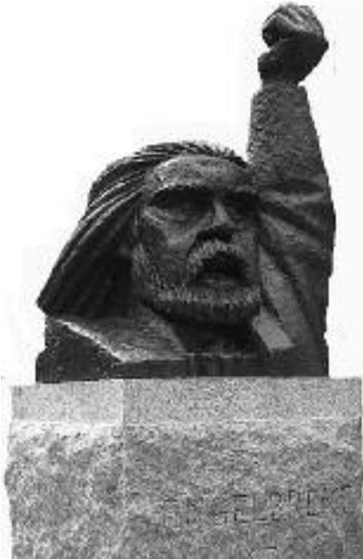
Ovan: Skillnaden är friheten, ty ”frihet är det bästa ting som sökas kan all världen kring” ( Biskop Thomas frihetsvisa till Engelbrekt år 1433). Bild av Bror Hjorts Engelbrekt. Nedan och till höger: Korna på väg till mjölkning Får och kor betar på samma ytor.