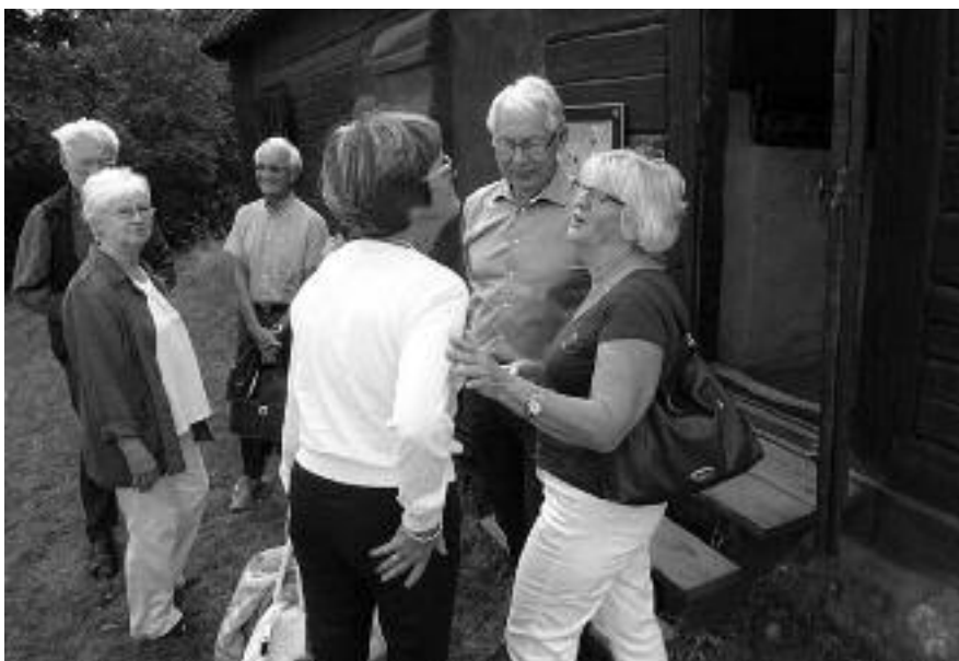
Välkommen till Bagarstugan!

åren, men även idag finns det "Bovin-kluster" i Stockholm, Hudiksvall och Lycksele. Vi kusiner har givetvis träffats en hel del som barn, men förstås inte lika mycket och ofta som dubbelkusinerna på Lovön. Våra Lyckselekusiner är yngre och har inga barndomsminnen av oss andra att tala om.