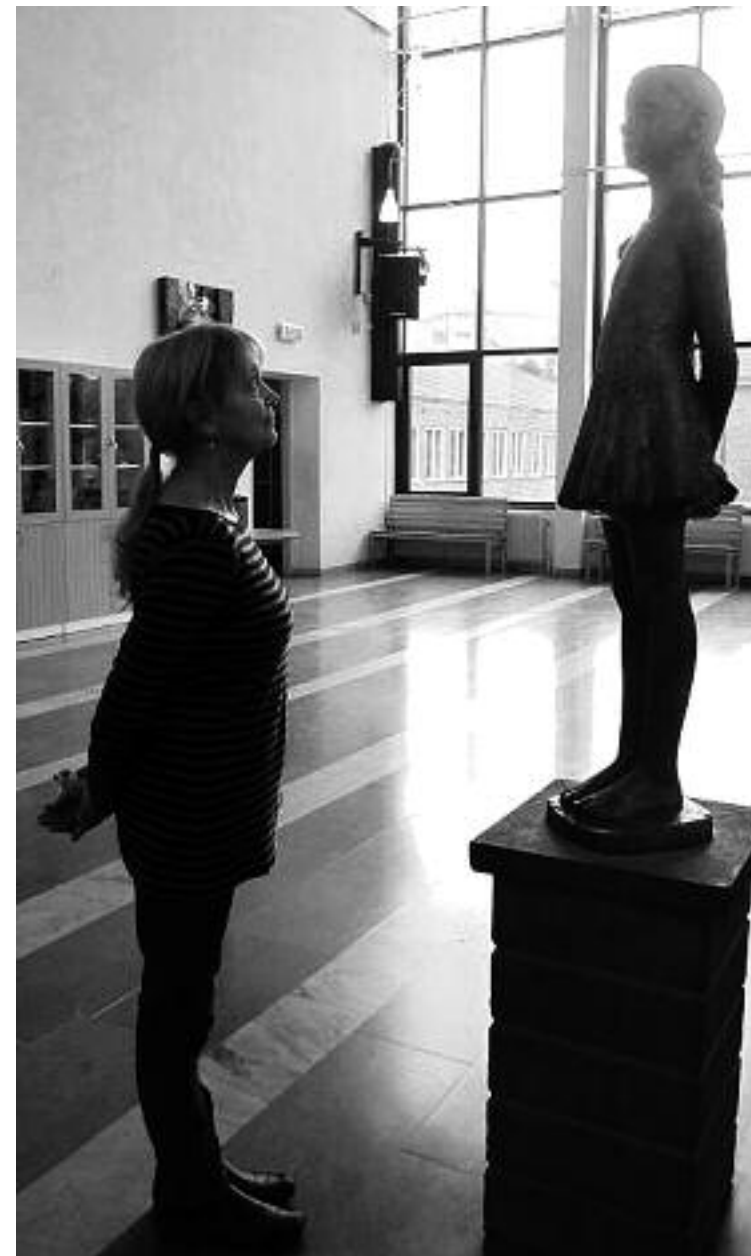
Cilla möter Cilla, 2015

Jag gick närmare. Plötsligt gick det upp för mig vem skulpturen föreställde. Där var Cilla, livs levande framför mig! Men inte den Cilla jag