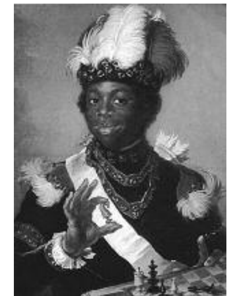
Badin, pastell av G Lundberg

Källor: Edvard Matz: På Gripsholm, Sthlm 1987 Ulf G Johnsson: Porträtt, Nationalmuseum, Sthlm 1987