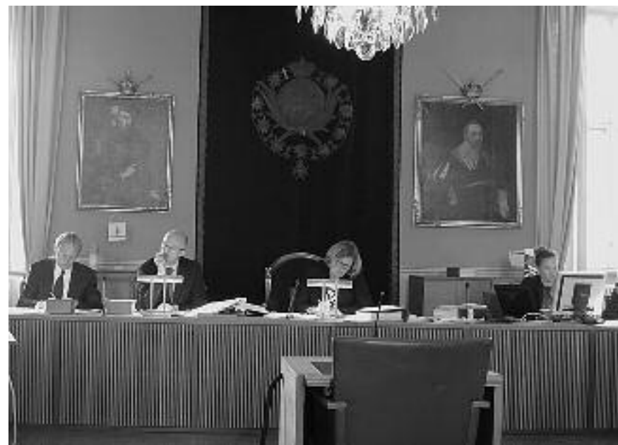
Mark- och Miljööverdomstolens jurister

överklagades till Mark- och Miljööverdomstolen av föreningarna ARG Arbetsgruppen Rädda Grimstaskogen, NTV Nej till Västerleden (Sätra), Mälaröarnas Naturskyddsförening, DLV, Djurgården- Lilla Värtans miljöskyddsförening, och Rädda Lovö. Skälet var att domstolen