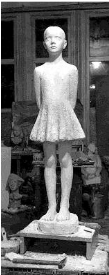
Första gipsgjutning, Drottningholm 1952