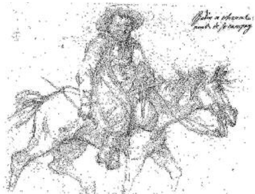
”Badin till häst återvändande från landet”, teckning av J T Sergel (Nationalmuseum)