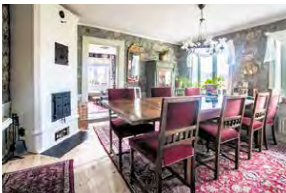
Nyrenoverad sal 2017