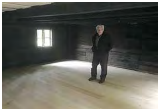
Så fint golv Bagarstugan har fått!