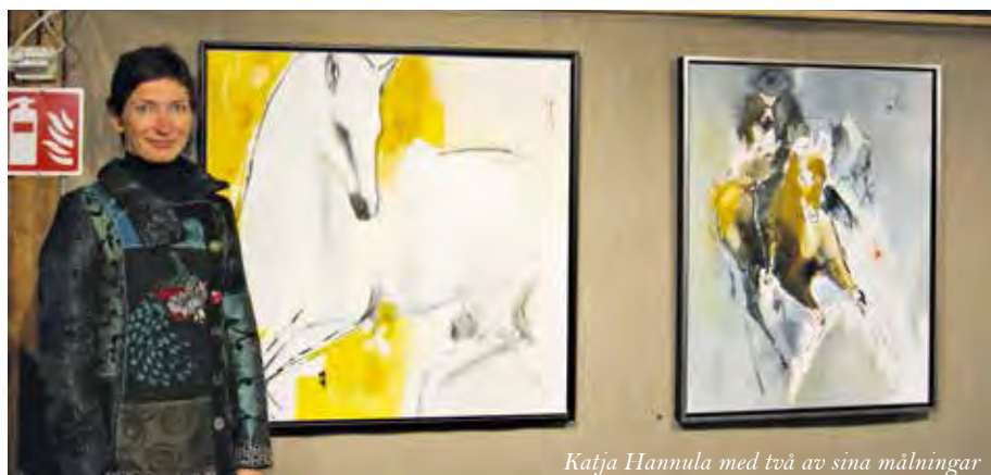
Katja Hannula med två av sina målningar