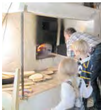
Kyllis barnbarnsbarn vill vara med

Känner du till hembygdsföreningen stadgar? De är ganska precisa och kan sammanfattas till att vi ska värna Lovös landskapsbild och skydda kulturlandskapet, vårda och förvalta Lovös kulturlandskap. Vi ska också vårda åt föreningen anförtrödda byggnader. Om du vill veta mer finns stadgarna på hembygdsföreningens hemsida.