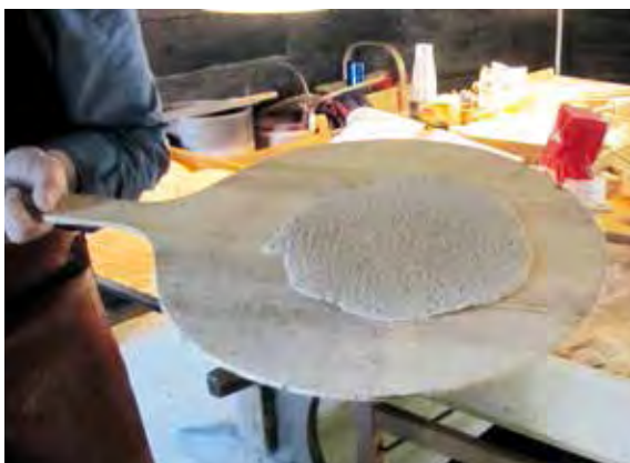
Nu ska Håkans deg in i ugnen