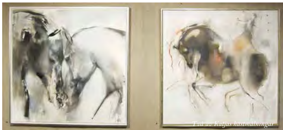
Två av Katjas hästmålningar