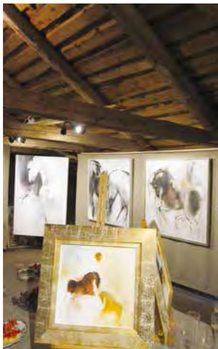
Visst passar Magasinets övre plan för konstutställningar?

Den tidigare Museigruppen skrev till styrelsen om att den behövde paus i arbetet med Magasinets hembygds-museum och att den önskar en ny organisation av arbetet. Styrelsen