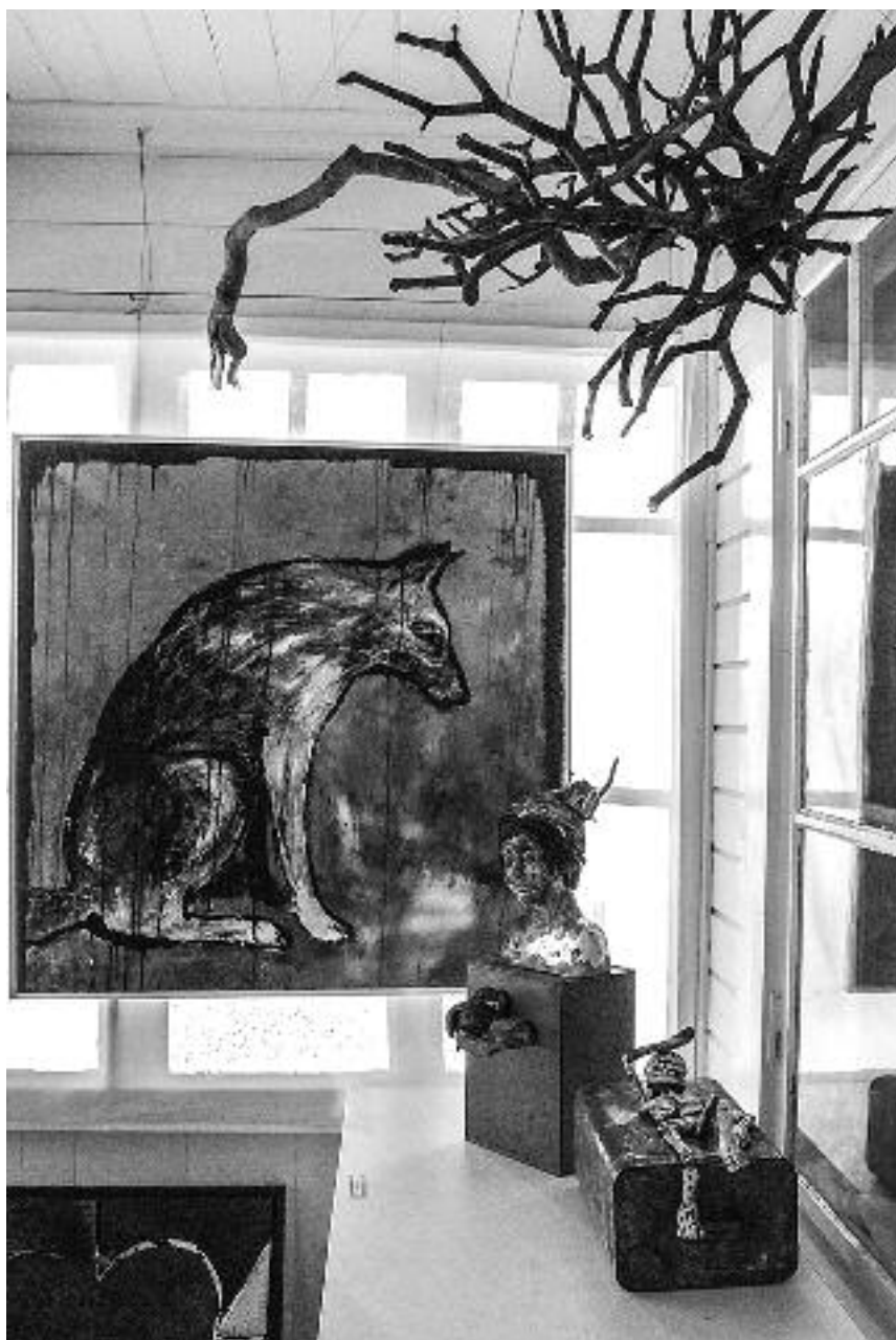
Paviljongens veranda fungerar tidvis som konstgalleri.