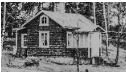
Överst: Oskarsborgs huvudbyggnad kring år 1920. Mitten: Huvudbyggnaden år 2008. Eternitplattorna har avlägsnats och de ursprungliga panelerna utgör en spöklik anblick. Längst ner: I detta hus, vars ytterväggar var helt täckta med fjäll, bodde Oskar Wilhelm Napoleon under flera år efter faderns bortgång.

sig snarare som ett naturfenomen än någonting som anlagts för praktiska ändamål. De hus man passerar förstärker intrycket av att ett irrationellt eller romantiskt element här fått komma till tals.