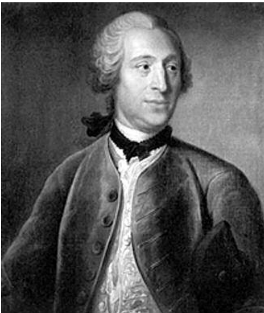
Olof von Dalin av Johan Henrik Scheffe. Målningen är lätt beskuren.

kalottsällskapet, skapat vid Lovisa Ulrikas hov för att förgylla den ljusa årstidens interna underhållning på Drottningholm och framför allt på