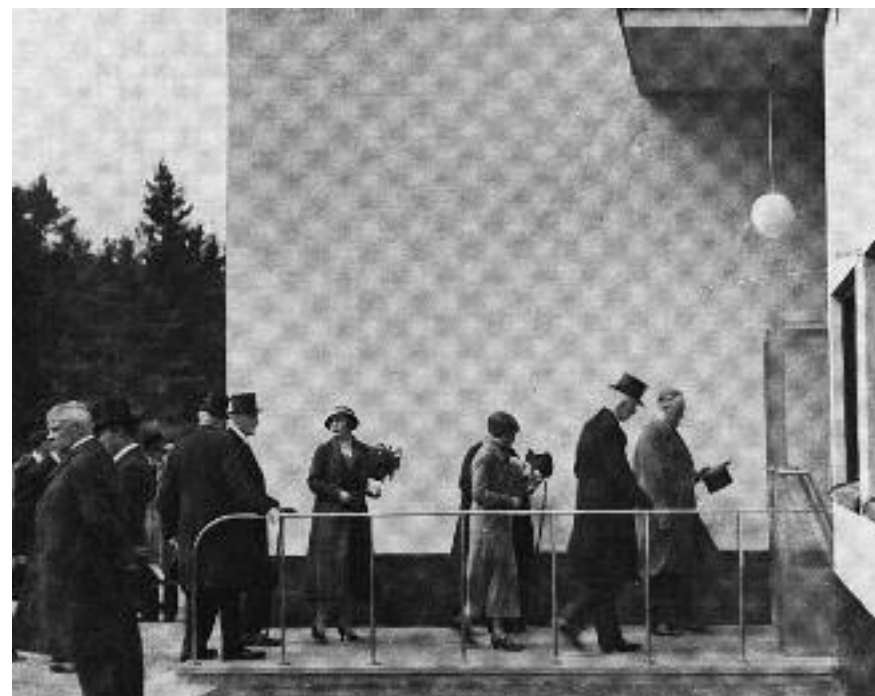
Gustav V inviger vattenverket 1933.