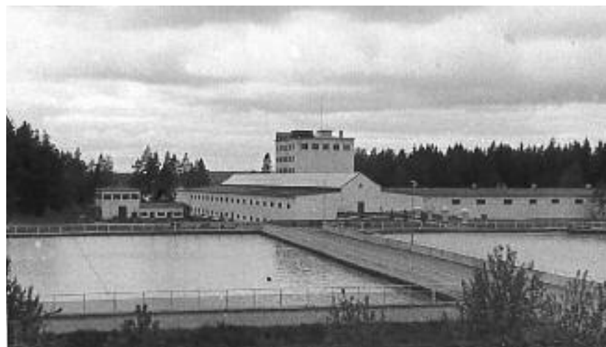
Vår morfar hade redan 1930 fått arbete som reparatör och föreståndare för verkstaden vid Lovöverket (vattenverket var ännu inte byggt då).