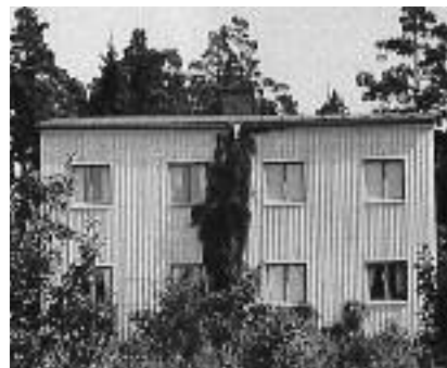
Den första bostaden fick familjen i en av de vita villorna.