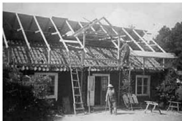
Ombyggnad av nya huvudbyggnaden, år 1946.