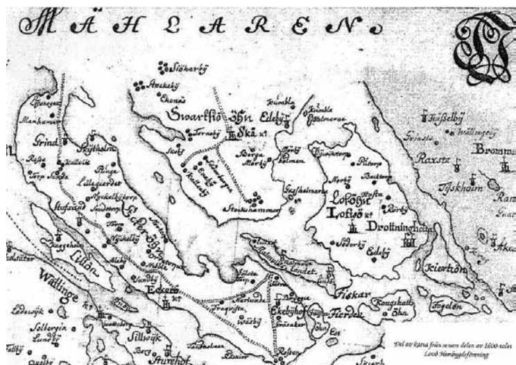
Del av karta från senare delen av 1600-talet. Lovö Hembygdsförening.

Några Hedemorahöns krafsar i en backe och tuppen ger lantlig trivsel.