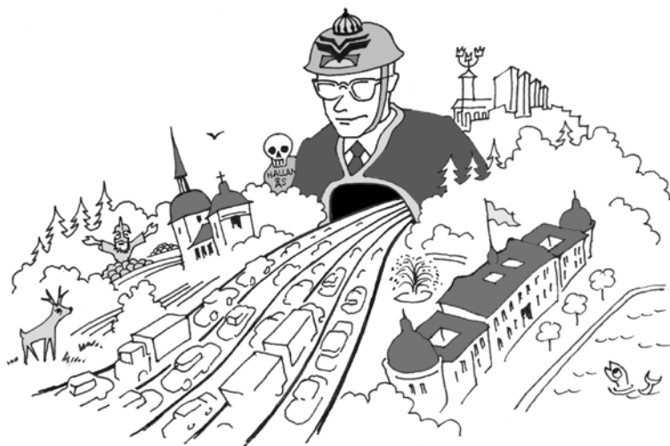
ILLUSTRATION: PETER TUCKER

”ICOMOS SWEDEN avråder starkt Vägverket från att genomföra i arbetsplanen redovisade anslutningar till väg 261 och därmed sammanhängande breddning av vägen genom Världsarvet Drottningholm. ICOMOS SWEDEN avråder starkt Ekerö kommun från att framhärda