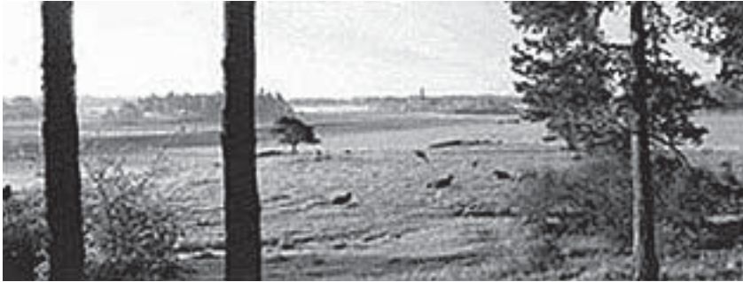
Utsikt mot Lovö Kyrka från Prästvikskogen .

Avs: Nedre Viken, PL 112 178 93, Drottningholm