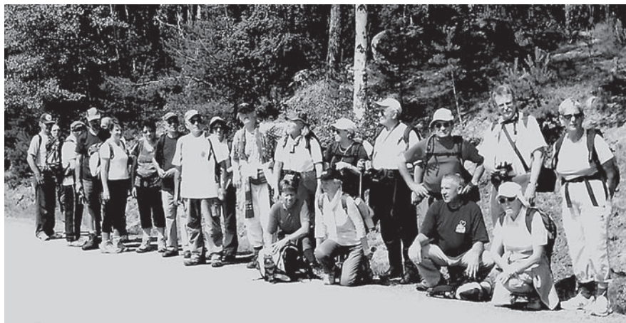
Glada fornstigsvandrare från Cognac i Frankrike.