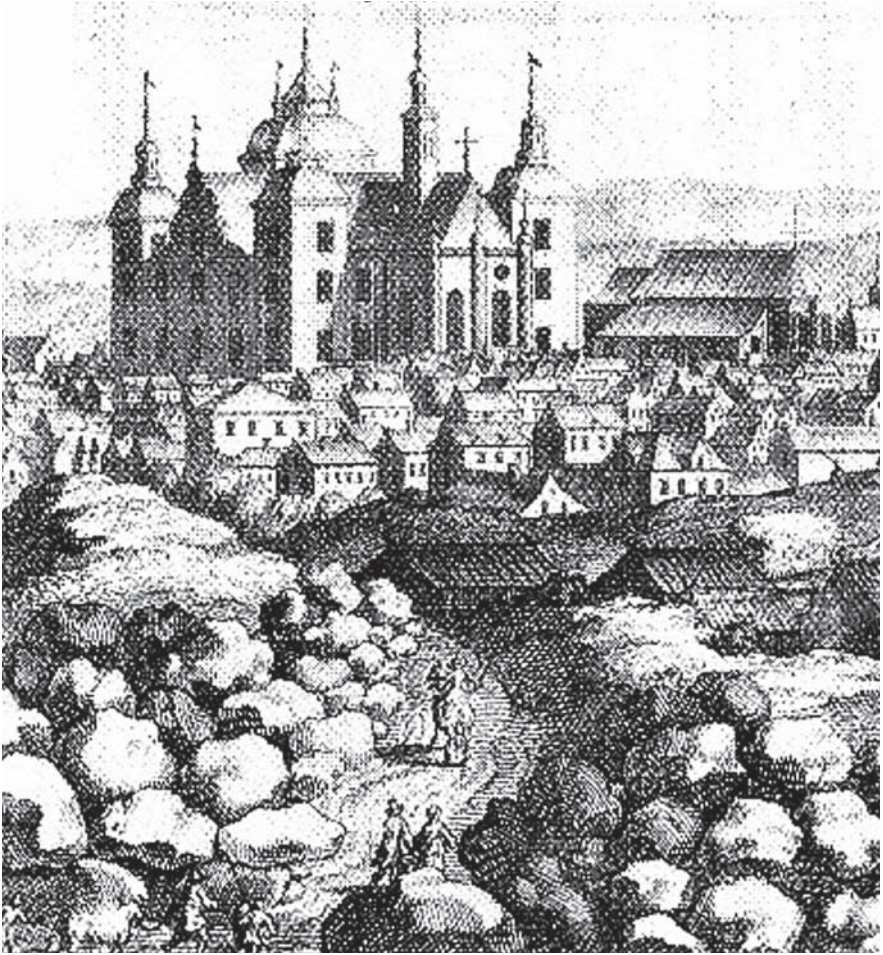
Kanske liknade Johan III:s Drottningholm Gävle slott med kyrkan i det framskjutande mittpartiet, ur Suecia Antiqua et Hodierna.

källarvåningen. Fyra kompletterande prov utfördes senare under månaden. Den byggnadsantikvariska undersökningen kan sammanfattas på så sätt, att i rum 126 och 127 i källarvåningen finns tegelytor från Johans III:s tid, som uppvisar sotiga ytor från branden år 1661. På