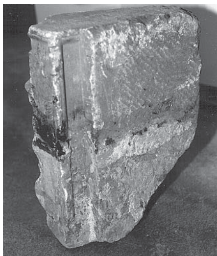
Arkitekturfragment av Lenabergsmarmor med sotrand från branden 1661.

påbyggnad och förändring vidtar. Ingen undersökning utfördes på norrväggen i detta våningsplan. Endast interiör av det förmodade Johan III:s slott uppvisar brandspår.