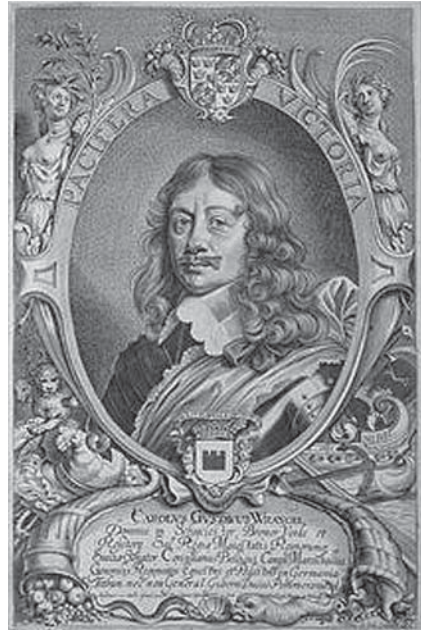
Carl Gustaf Wrangel

Tidigt kom Skokloster att betraktas som ett historiskt monument, nästan som ett privatägt Gripsholm. Det påverkade Magnus Brahe som på 1830- och 40-talen lät förändra byggnaden. Sedan Staten köpt in Skokloster 1967 inleddes ett epokgörande restaureringsprojekt under Ove Hidemarks ledning. För att respektera slottets patina och årsringar, använde man sig av äldre material och tekniker, som då nästan hunnit bli bortglömda. Ove Hidemark och Elisabet Stavenow-